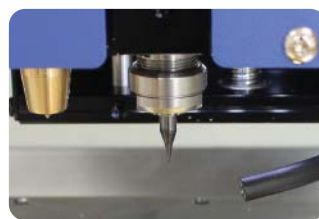
Broche avec pince de serrage